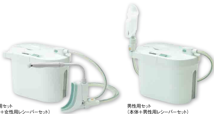
女性用セット（本体+女性用レシーバーセット）

レシーバーをあてがい排尿すると、自動的に尿を吸引します 尿意があるがトイレへの移乗が困難な方、夜間転倒のリスクがある方、し瓶をご利用の方で、し瓶を片づける手間を軽減したい方などにお勧めです